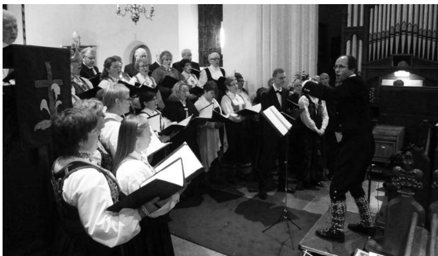
Lardal kantori i aksjon i den vesle landsbykirken i Bergh-Apton.